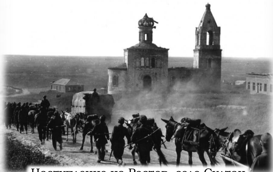
Наступление на Ростов, село Султан Салы, фото оккупантов 1942 год

События первых дней войны развивались не в нашу пользу. К середине ноября 1941 года враг вплотную подошел к сердцу нашей Родины - Москве.