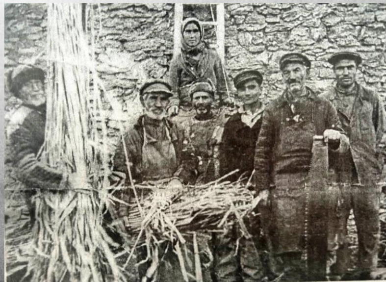
Строительная бригада колхоза «Политотдел» на восстановлении коровника, 1943 год

Все рабочие тракторы и сельскохозяйственные животные были изъяты и отправлены на фронт, оставив крестьян с устаревшей и неисправной техникой, ручными орудиями труда и старыми лошадьми. Рабочий день во время посевной начинался в 4 часа утра и завершался с наступлением ночи. Голодному населению нужно было успеть еще и позаботиться о своих личных наделах. Кроме того, колхозников часто привлекали к другим работам: возводить оборонительные сооружения, восстанавливать разрушенные бомбежками здания, возводить дороги и т.п.