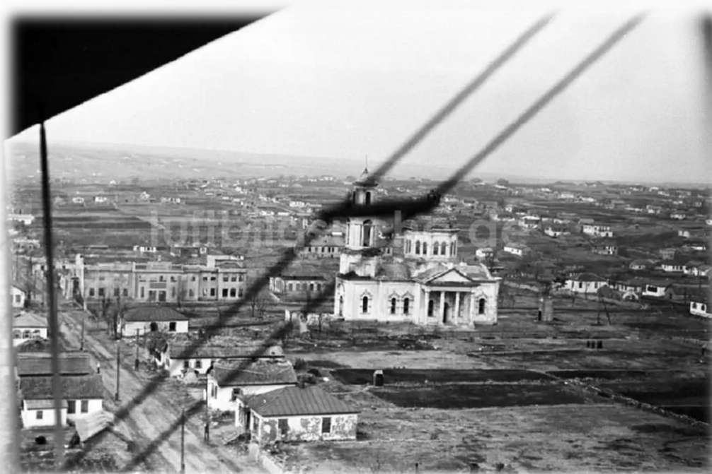
1942 г., село Чалтырь церковь Сурб Амбарцум, немецкая аэрофотосъёмка

Извеще ние О порядке приема и отправления международной и внутренней почтово-телеграфной корреспонденции в военное время В связи с военной обстановкой в стране, в целях пресечения разглашения государственной и военной тайны и сообщений, направленных во вред государственным интересам Советского Союза, через почтово-телеграфную переписку—Наркомат связи установил следующий порядок приема и отправления международной и внутренней почтово-телеграфной корреспонденции в военное время. 1. Запрещается сообщать в письмах и телеграммах какие-либо сведения военного, экономического или политического характера, оглашение которых может нанести ущерб государству. 2. Всем почтовым учреждениям запрещается прием и посылка почтовых открыток с видами или наклейками фотографий, писем со шрифтом для слепых, кроссвордами, шахматными задачами и т. д. 3. Запрещается употребление конвертов с подкладками. 4. Все международные почтовые отправления должны сдаваться отправителем лично в почтовое отделение. Марки на такие отправления наклеиваются при приеме почтового отправления самими почтовыми работниками. 5. Установить, что письма не должны превышать четырех страниц формата почтовой бумаги.