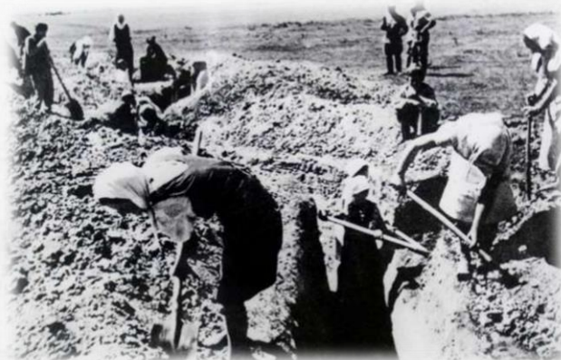
1942г. Жители донских сёл строят оборонительные сооружения

«О мобилизации местного населения и гуж транспорта на строительство оборонительного рубежа» протокол № 1 от 3.03.1943 г. заседания Исполнительного комитета Мясниковского района (Ф.Р-2. Оп.1. Д.3. Л.4)