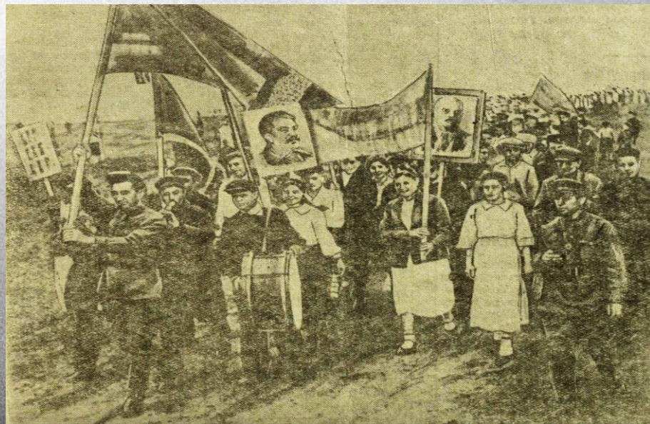
Первомайская демонстрация в селе Чалтырь. 1 мая 1941 год.